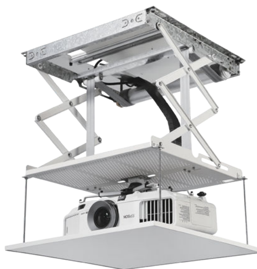
ME2000P / ME3000P