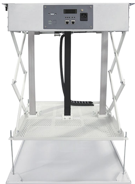
ME2000E ~ ME4000E

性能動力再提升25%，投影機亦擁有更寬敞的放置空間，各式投影機都適用。無論是商務、教育、娛樂的環境，都能滿足不同場所的安裝需求，帶來卓越的使用體驗。