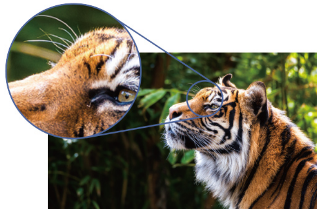
<1080p解析度所提供的影像更加銳利與細緻>

可從個人電腦和其他裝置中讀取所有資訊，有助於確保傳輸順暢。通常，顯示清晰影像所需的解析度會隨螢幕尺寸增加而增加。